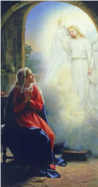
The Annunciation by Carl Bloch

**Melek Cebrail Allah tarafından Celile'de Nasıra denilen bir şehirde Davut ailesinden Yusuf adındaki bir adama nişanlı olan bir genç kıza gönderildi. Bu genç kızın adı Meryem idi. Melek onun evine girdi ve ona: "Sevin ey Allahın lûtfuna sahip olan sen, Rab senindedir" dedi. O ise bu sözlere çok şaşırıldı. Bu selâmın ne anlama geldiğini kendi kendine soruyordu. Fakat Melek ona: "Korkma Meryem, çünkü Allah önünde inayet buldun. Hamile kalacaksın, bir oğul doğuracaksın ve ona İsa adını vereceksin. O büyük olacak ve ona Yüce Allah'ın oğlu denecek. Rab Allah ona atası Davud'un tahtını verecek. Yakub'un ailesi üzerinde ebediyen saltanat sürecek ve onun hükümranlığının hiç sonu olmayacaktır." Meryem Melek'e: "Bu nasıl olacak, çünkü ben