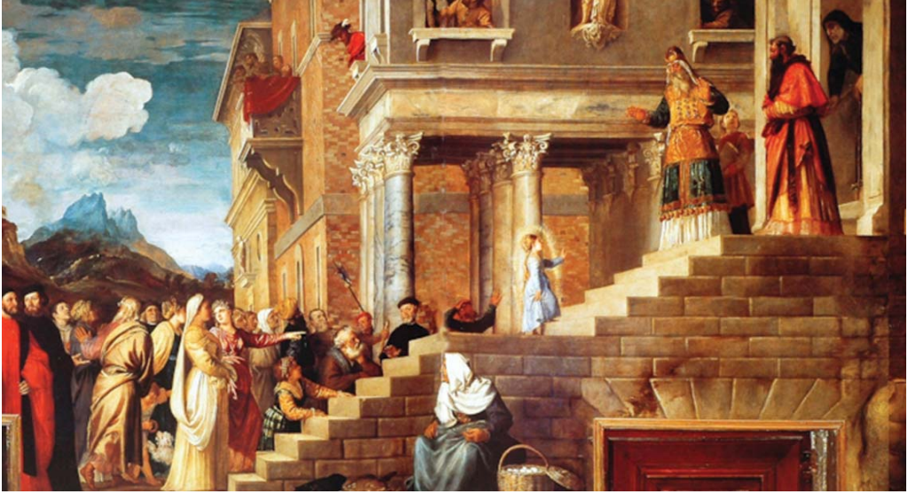
Resim: Bakirenin Mabetle Tanışması, Tiziano Vecellio (Titian), 1534-1538