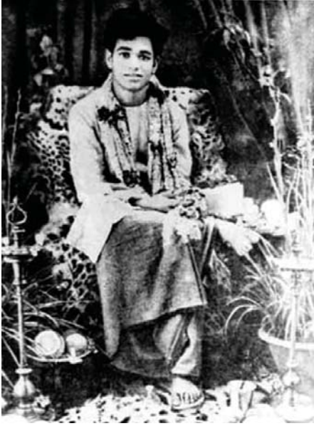
Sai Baba 1940'larda

kişileri aileye getirdiler. Ancak, bütün bu işlemler en ağır işkenceleri dahi gölgede bırakacak uygulamaları içeriyordu ve Sathya bunların hepsine sesini çıkarmadan katlanıyordu.