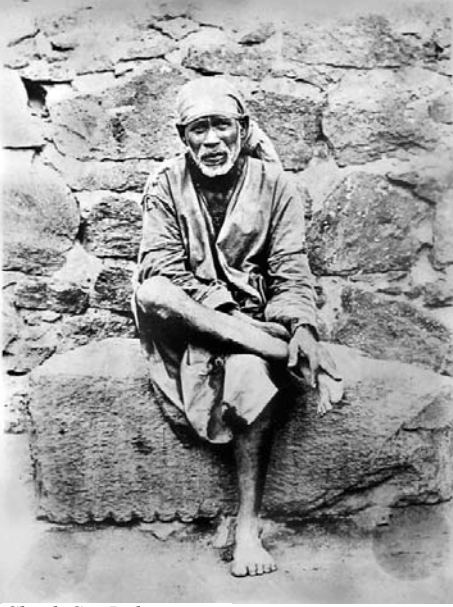
Shirdi Sai Baba

siyetiyle 2011 yılında Watkins Review tarafından 'yaşayan en etkili 100 spiritüel insandan biri' olarak listelenmiştir.