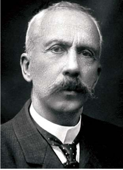
Charles Richet, Nobel sahibi

"Hazırlanan koşullar altında, kuvvetli ya da zayıf ışıkta görülen olayların hiçbirini, insan elinden çıkma herhangi bir araç kullanılarak meydana getirilemez."